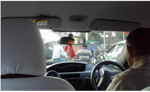
Conduire en Inde !